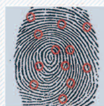
Points caractéristiques repérés par le logiciel appelés « Minuties »